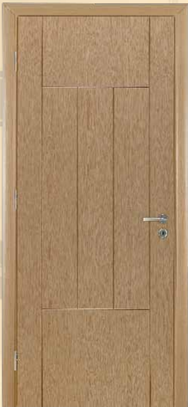
221 δρυς τεχνιτό / με νερά