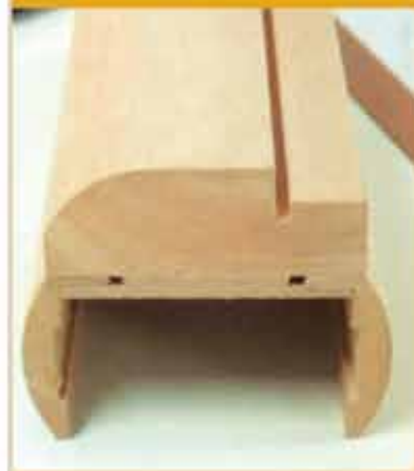
τομή οβάλ μασίφ κάσας