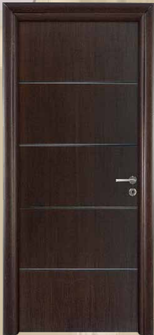
214 Ανγκρέ / χρώμα 330