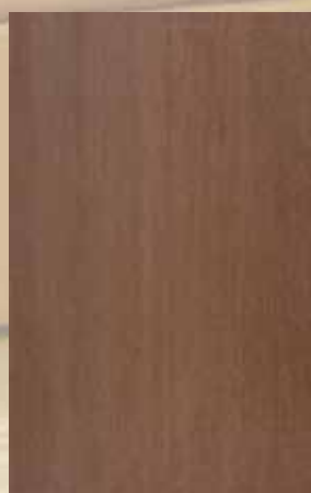
190 - ΑΝΙΓΚΡΕ