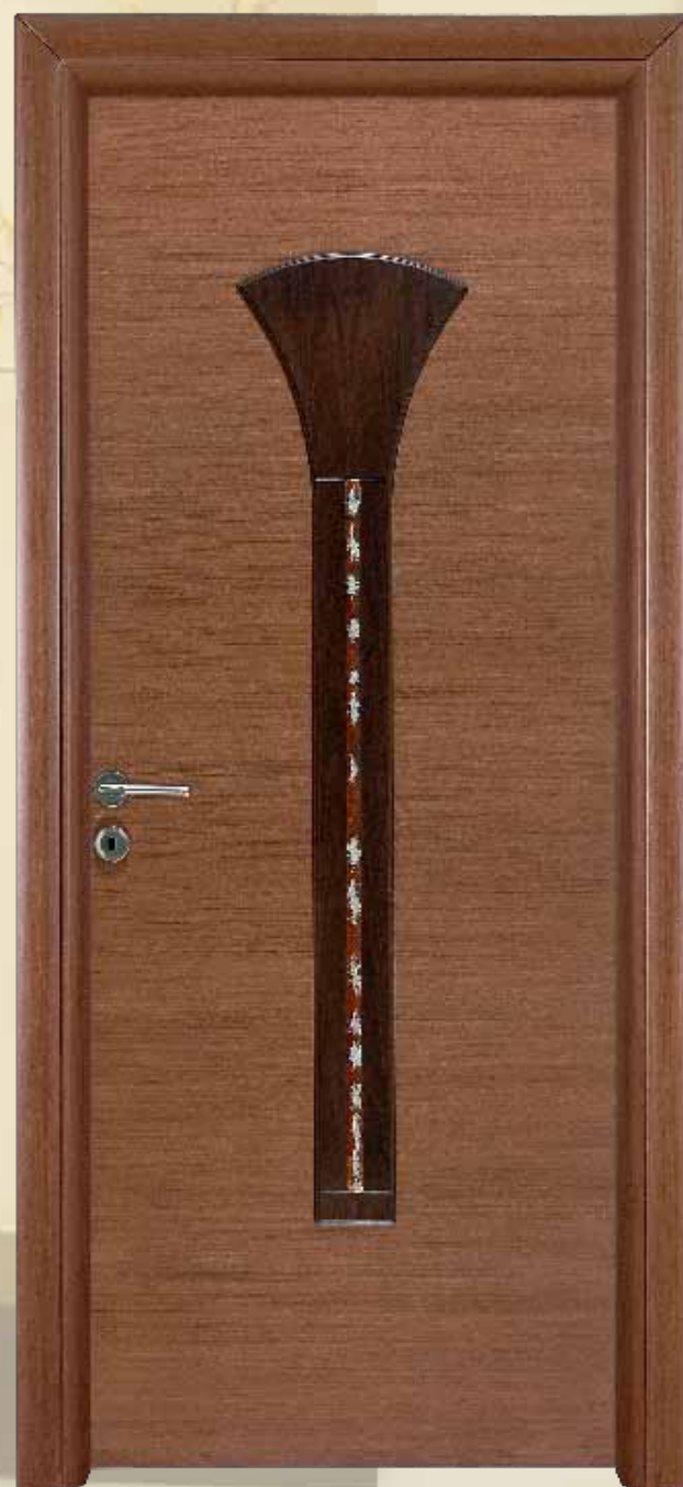
343 ανιγκρέ τεχνιτό / χρώμα 106