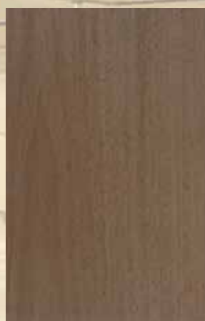
102 - ΑΝΙΓΚΡΕ