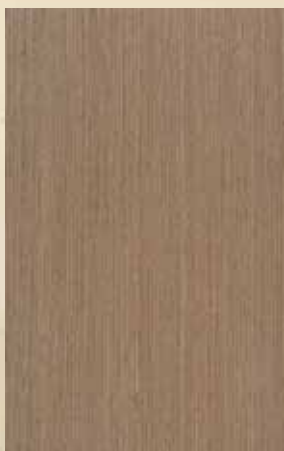
ΦΥΣΙΚΟ ΧΡΩΜΑ ΩΡΥΣ ΤΕΧΝΙΤΟ