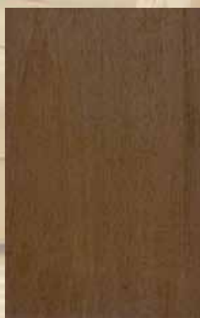
106 - ΑΝΙΓΚΡΕ