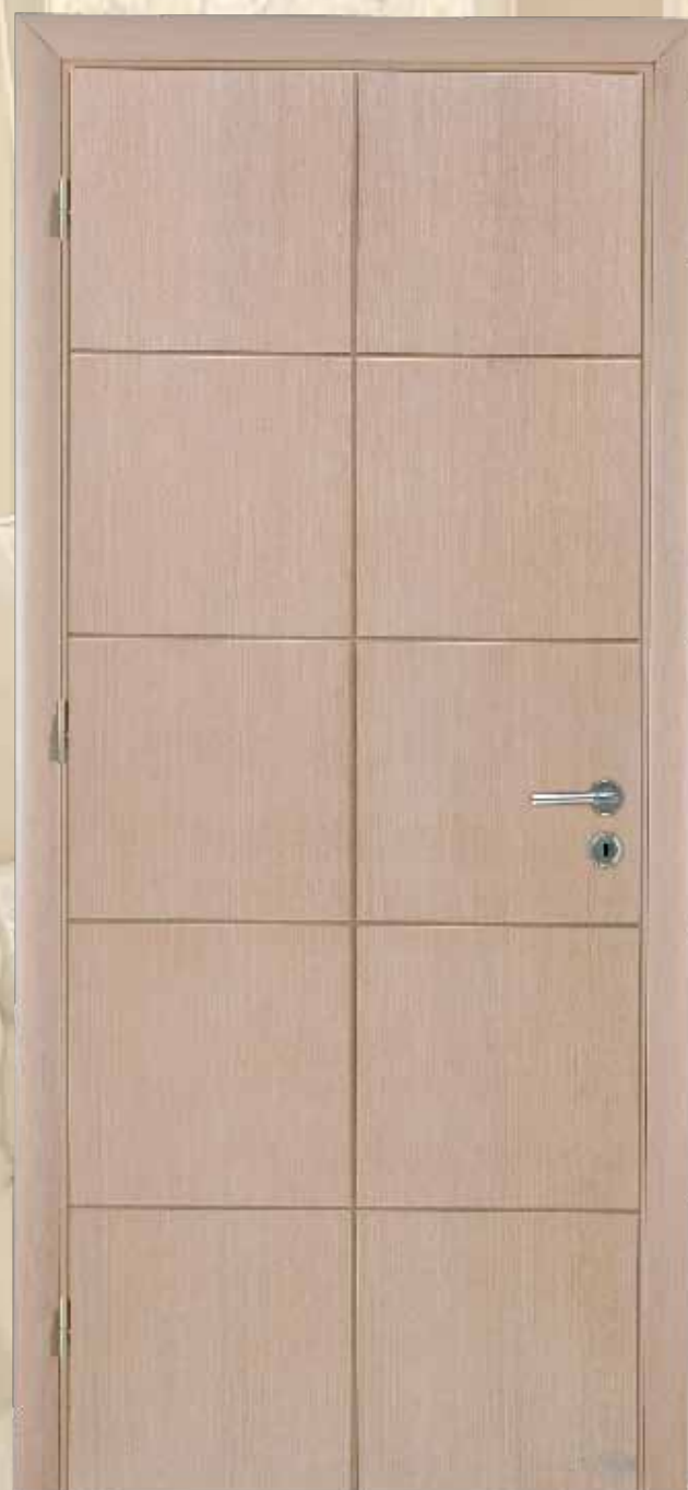
217 Ανγκρέ / χρώμα F3