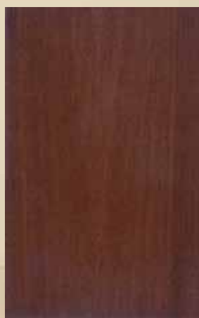
364 - ΑΝΙΓΚΡΕ