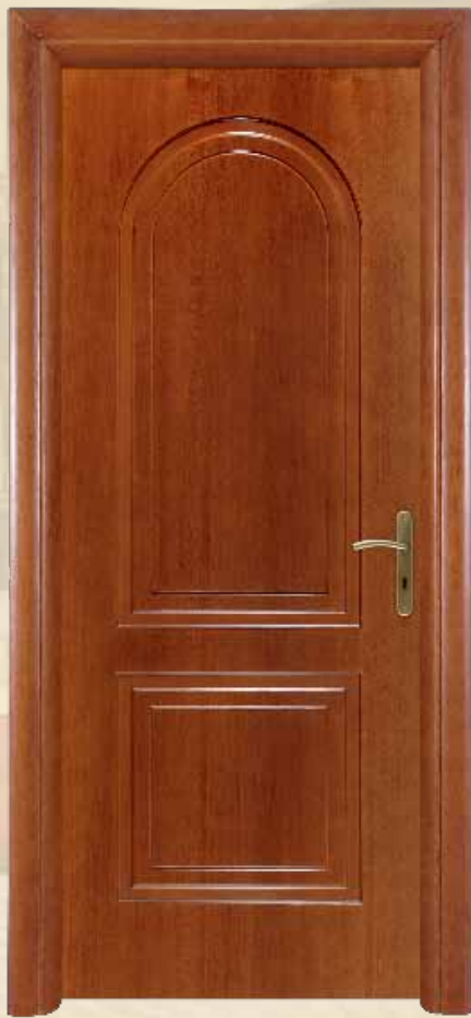
142D αιγιό εργαθίό