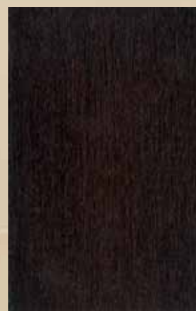
2010 - ΩΡΥΣ ΒΕΓΚΕ