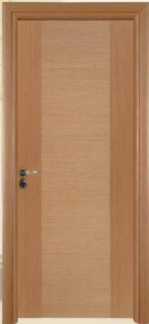
349 ανιγκρέ τεχνιτό