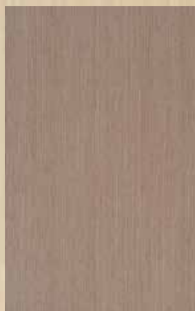
F3 - ΩΡΥΣ