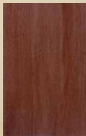
1003 - ΑΝΙΓΚΡΕ