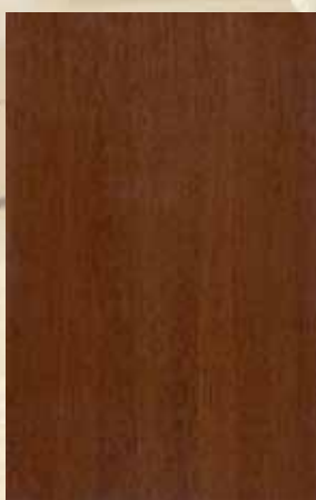
77 - ΑΝΙΓΚΡΕ