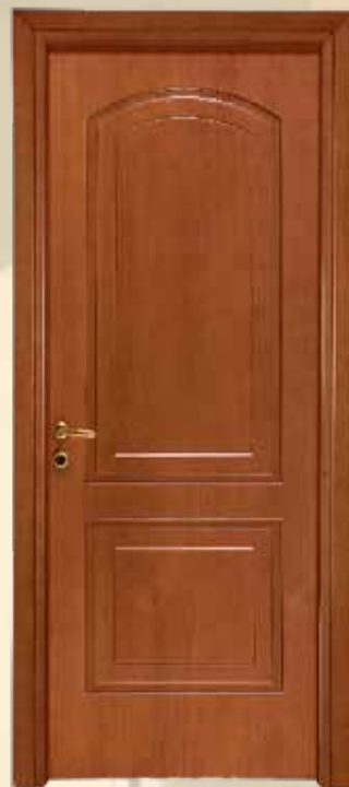
103D αιγιό εργαθίό