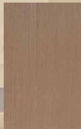
ΦΥΣΙΚΟ ΧΡΩΜΑ ΑΝΙΓΚΡΕ ΤΕΧΝΙΤΟ