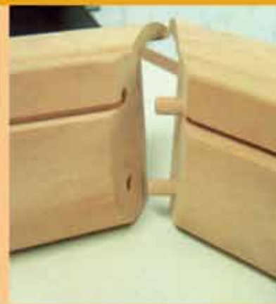
μόρσα (ενώσεις) κάσα