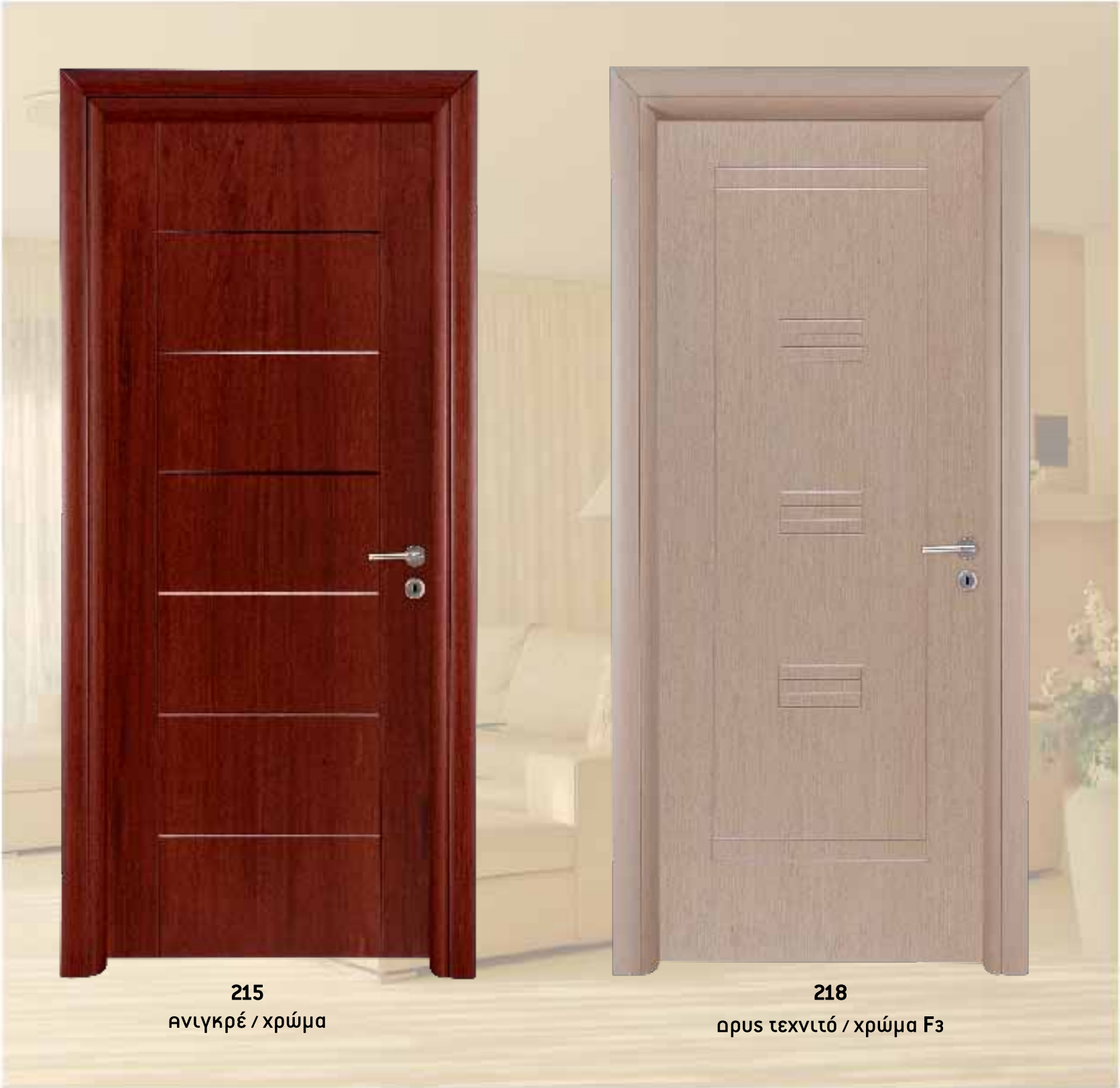
215 Ανγκρέ / χρώμα