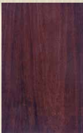
5540 - ΑΝΙΓΚΡΕ