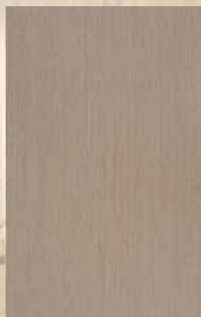
F2 - ΩΡΥΣ