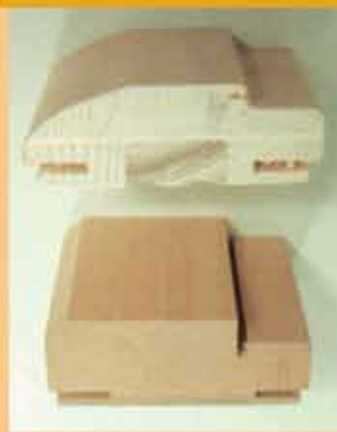
τομές μασίφ & πλακάξ κάσας