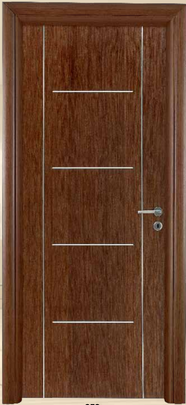
352 αρυσ τεχνικό / χρώμα