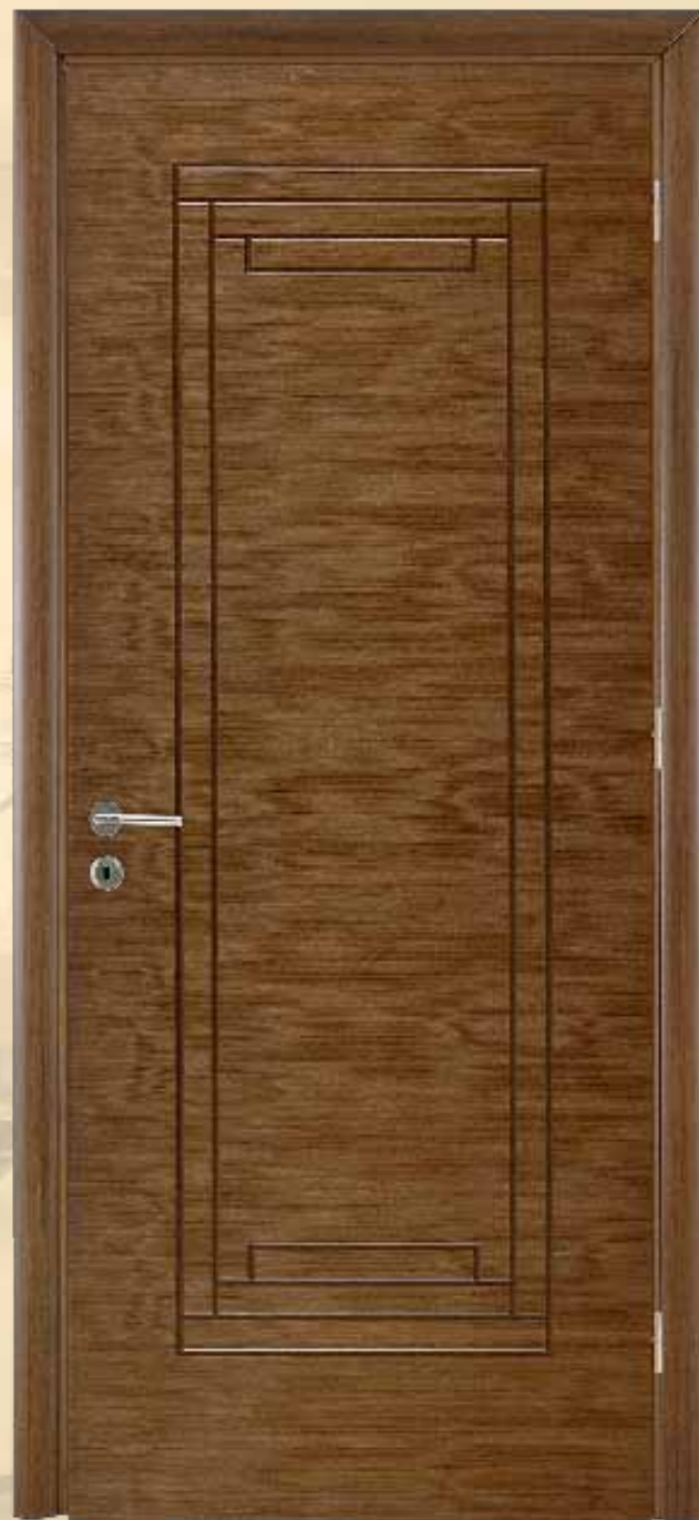
222 δρυς τεχνιτό / οριζόντια νερά