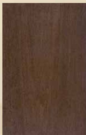
330 - ΑΝΙΓΚΡΕ